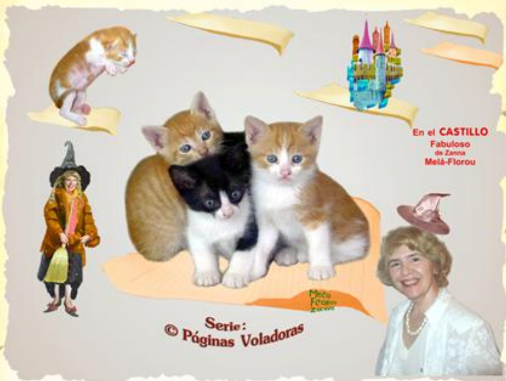
En el CASTILLO Fabuloso de Zanna Melá-Florou