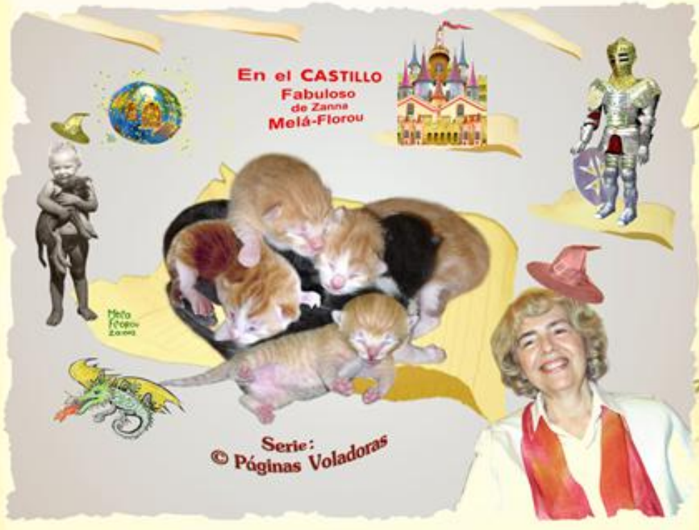
En el CASTILLO Fabuloso de Zanna Melá-Florou