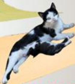
En el CASTILLO Fabuloso de Zanna Melá-Florou