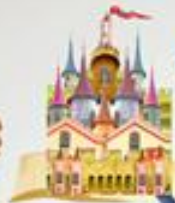
Serie: © Páginas Voladoras En el CASTILLO Fabuloso de Zanna Melá-Florou